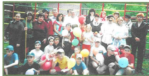
Встреча с немецкими друзьями