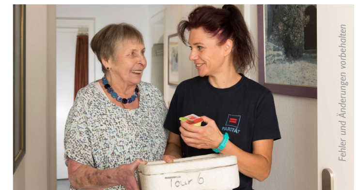
Fehler und Änderungen vorbehalten