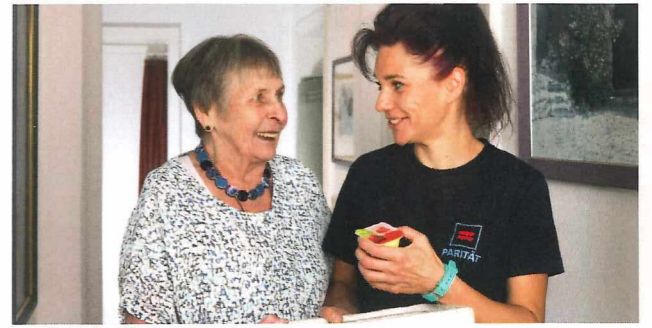
Fehler und Änderungen vorbehalten