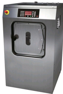
Steuerung ARIES ELITE - Modellreihe IH