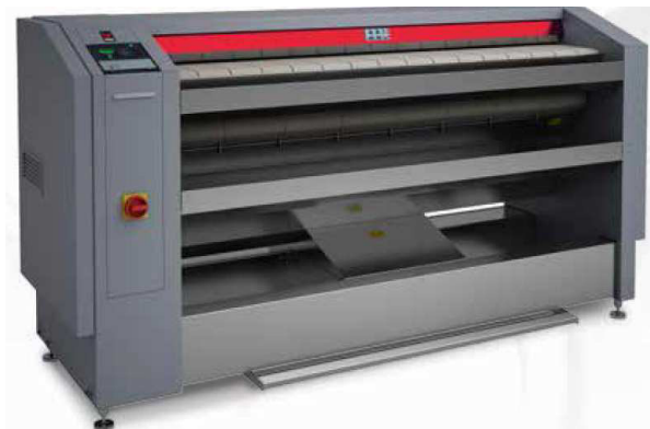
FCI 1664-320 G und FCI 2000-500 G