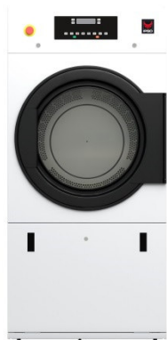
IHP 190 – IHP 345