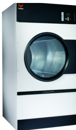
DR 25 – DR 75

Energieverbrauch um 25% reduziert, bei gleichbleibender Trocknungszeit