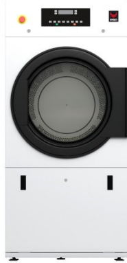
IHP 190 – IHP 345