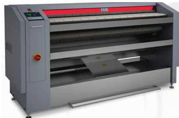
FCI 1664-320 G und FCI 2000-500 G